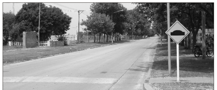
Los reductores de velocidad ahora cuentan con nueva señalización.

Tal como se viene desarrollando desde febrero del año pasado, la Comuna de Santa Isabel trabaja en forma permanente para mantener y ampliar las señalizaciones urbanas, tanto en carteles nomencladores como en las señales de tránsito.