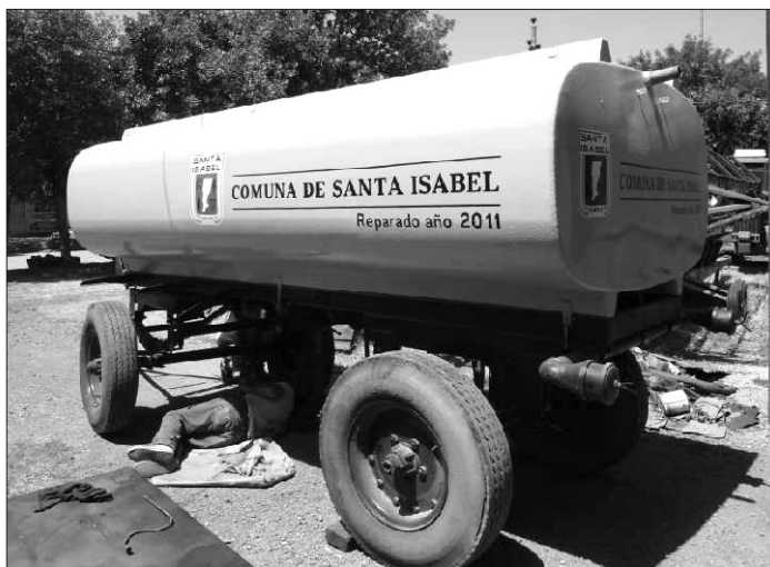
El equipo en plena reparación.

La Comuna cuenta con tres unidades de esta clase. Este regador, que estuvo fuera de servicio por un corto períodos para su reparación, ahora se sumó al trabajo. Junto al nuevo surtidor de agua de la zona cercana a ruta 94 se ha mejorado notoriamente el servicio de riego en calles de tierra o enripiadas.