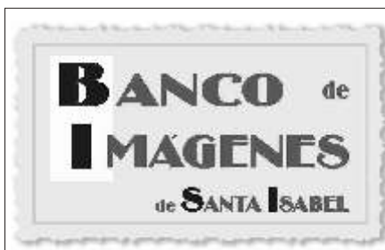
El Banco ya lleva catalogadas más de 1.500 imágenes de Santa Isabel.

El objetivo es preservar y difundir el patrimonio histórico y visual de la localidad. Además, como su utilización es libre, el material puede ser objeto de trabajos escolares o para medios de comunicación gráficos o televisivos.