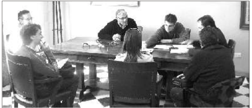
Una de las aperturas de sobres en la sede comunal.

Son para la red de gas a Barrio Belgrano y para el entubado de Av. Sarmiento.