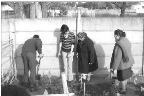
Las Hermanas Cari explican el ritual de la Pachamama en la escuela N° 214.

Sobre el ritual de la Pachamama explicó que éste se hace en agosto. "La Pachamama nos dice que cuidemos el medioambiente, la flora, la fauna, que respetemos la dignidad del otro, que no avasallemos, nos dice no a la soberbia. Y eso nos atraviesa de norte a sur por los cuatro puntos cardinales".