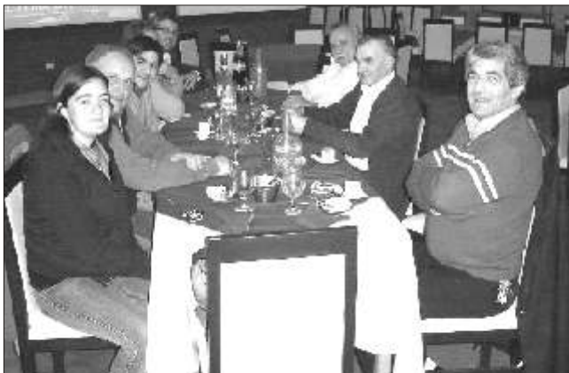
Integrantes del Centro Económico de Firmat compartieron una cena con autoridades comunales.

El 14 de agosto se realizó la segunda de las reuniones que propicia la Comuna para la creación de un Centro Económico. En este encuentro estuvieron presentes los máximos exponentes a las autoridades del Centro Económico de Firmat, quienes volcaron sus experiencias y conocimientos a los concurrentes, entre ellos comerciantes e industriales de la localidad.