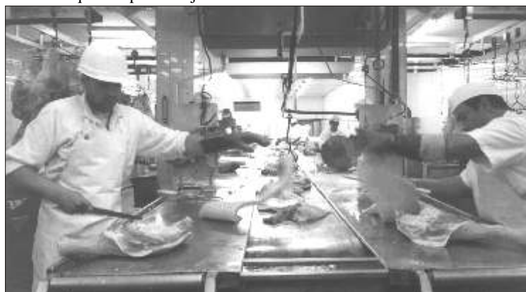
Por el trabajo: Los acuerdos cooperativos podrían asegurarlos.

Se analizó además las amplias posibilidades de integración de estas tres entidades que comparten objetivos comunes.