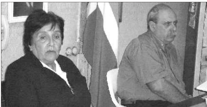
La Jefa de la Policía provincial dio explicaciones sobre la falta de seguridad en el sur de Santa Fe.