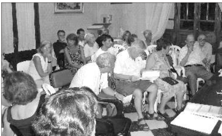
En esta reunión comenzó a gestarse la fiesta del Centenario