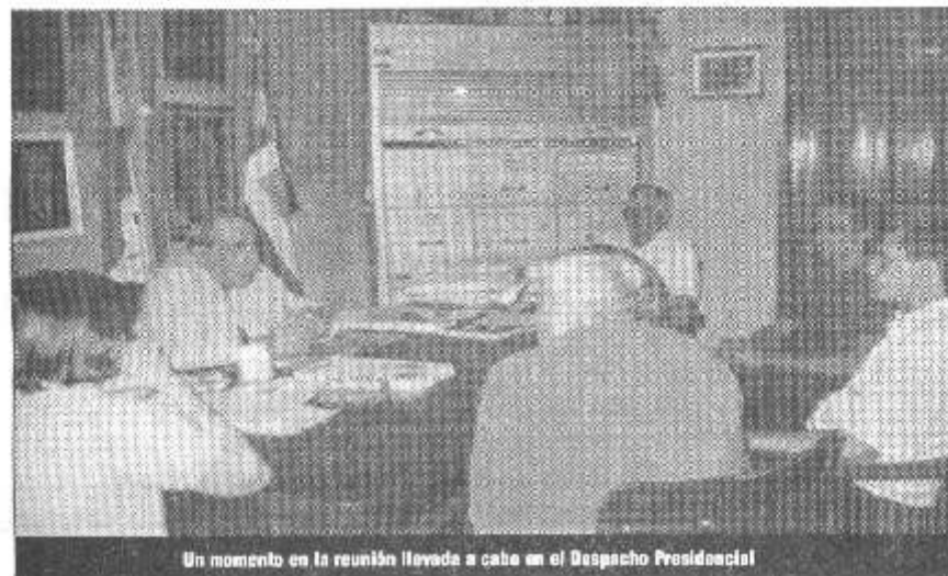
Un momento en la reunión llevada a cabo en el Despacho Presidencial

Se trataron diferentes problemáticas de los jóvenes y adolescentes