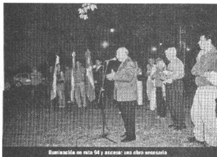
Iluminación en ruta 94 y acceso: una obra necesaria