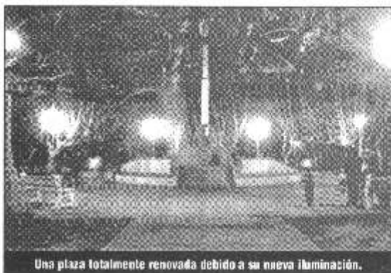
Una plaza totalmente renovada debido a su nueva iluminación.

Estos ejemplares extraídos fueron destinados a establecimientos educativos y el cementerio.