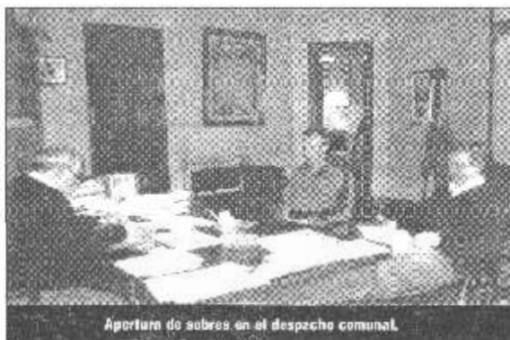
Apertura de sobres en el despacho comunal.

Solamente hubo un oferente, la firma Scapin S.R.L. de la ciudad de Rosario. El monto de la cotización fue de $ 106.000,-