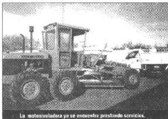
La motoniveladora ya se encuentra prestando servicios.

Fue totalmente recuperada, con una importante inversión comunal de $ 42.000,