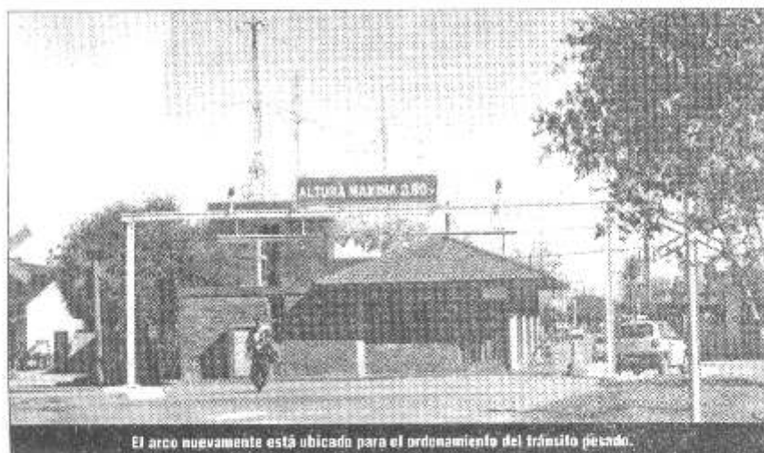
El arco nuevamente está ubicado para el ordenamiento del tránsito peatonal.

Después del accidente que sufriera el citado arco, está nuevamente colocado, por lo que solicitamos a los señores transportistas respetar la nueva señalización y así evitar que el mismo pueda sufrir otro deterioro.