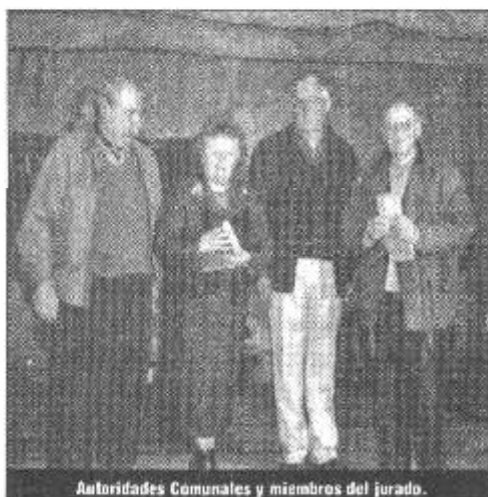
Autoridades Comunales y miembros del jurado.