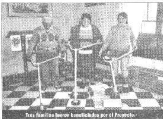
Tres familias fueron beneficiadas por el Proyecto.

En esta oportunidad son 3 los beneficiarios del Plan Jefes de Hogar que recibieron máquinas motoguadañas nuevas con todos sus accesorios e insumos. El objetivo es consolidar el Proyecto de mantenimiento de espacios verdes de la localidad.