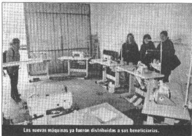
Las nuevas máquinas ya fueron distribuidas a sus beneficiarias.

El mismo funciona en calle Eva Perón, entre Gral. López y Belgrano.