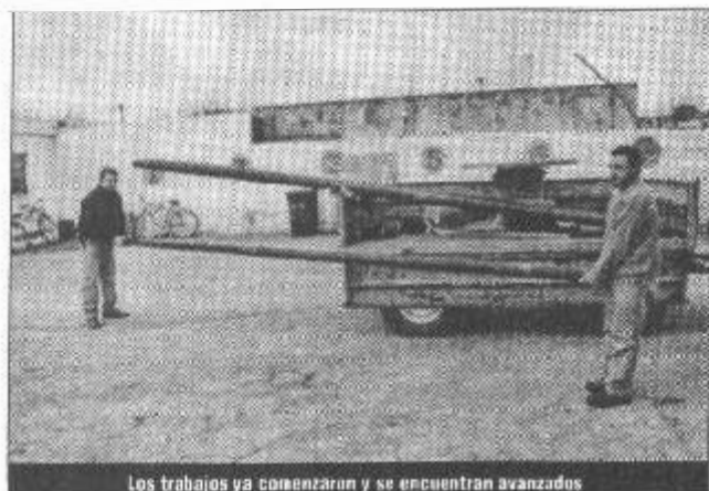
Los trabajos ya comenzaron y se encuentran avanzados

Ya está en marcha la renovación de la iluminación de nuestra plaza principal.