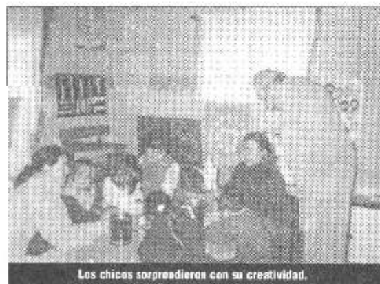
Los chicos sorprendieron con su creatividad.

Vale destacar el entusiasmo de los niños, motivados por sus docentes en la realización de los trabajos, quienes quedará en un pedacito de la historia de nuestro pueblo cuando se recuerde este concurso.