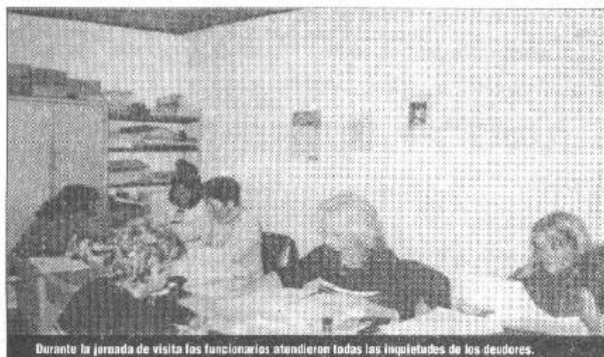
Durante la jornada de visita los funcionarios atendieron todas las inquietudes de los deudores.

En el marco del Decreto 2000 de la Dirección Provincial de Vivienda de la Provincia de Santa Fe, nos visitaron funcionarios de las áreas comercial, legal, y social de dicha Dirección para asesorar y formalizar convenios con deudores de cuotas de los distintos planes habitacionales de nuestra localidad.