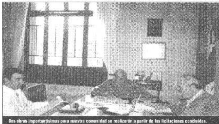
Dos obras importantísimas para nuestra comunidad se realizarán a partir de las licitaciones concluidas.

Se licitaron la iluminación de la Plaza 9 de Julio y ruta 94- acceso.