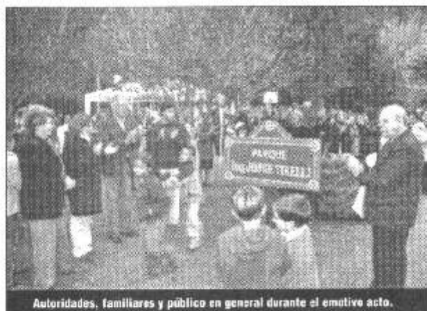
Autoridades, familiares y público en general durante el emotivo acto.

Masiva concurrencia de público a la inauguración del nuevo paseo de nuestra localidad.