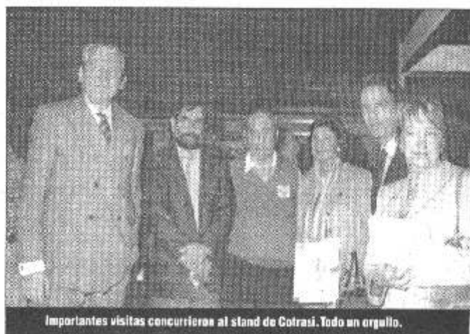
Importantes visitas concurren al stand de Cotrasi. Todo un orgullo.