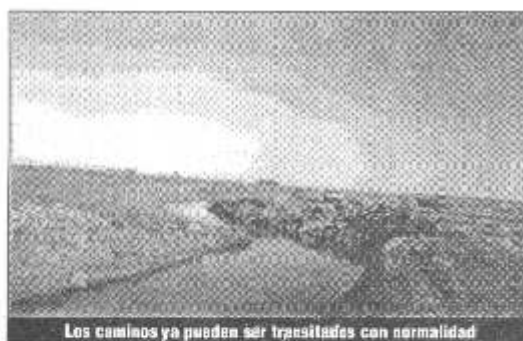
Los caminos ya pueden ser transitados con normalidad

Son los comprendidos en el límite con Villa Cañás.