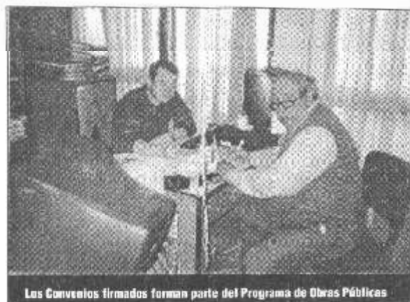
Los Convenios firmados forman parte del Programa de Obras Públicas

En la Gerencia de Empleo del Ministerio de Trabajo, Delegación Rosario, el Presidente Comunal firmó 2 nuevos convenios componentes materiales para obra aulas, sanitarios y obras complementarias en el Jardín de Infantes N° 42 por un monto de $ 64.234,59 y el otro proyecto es el cambio total del piso de la sala de la Sociedad Italiana de Santa Isabel por un monto de $ 39.220,01.