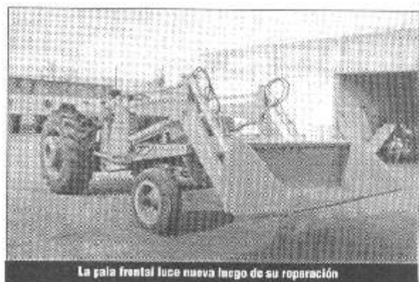
La pala frontal luce nueva luego de su reparación