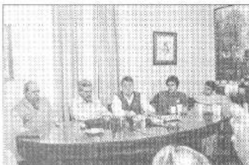
La conferencia de prensa se desarrolló en la ciudad de Villa Cañas

El Presidente Comunal participó en la ciudad de Villa Cañas junto al Intendente de esa localidad, el diputado Provincial Gabriel Real y jóvenes de los partidos políticos socialistas, radicales y demócratas progresistas, de una conferencia de prensa para seguir con la bonificación del 50% de los boletos de media y larga distancia para los estudiantes de nuestra región, lo que permitirá una igualdad de derechos para nuestros jóvenes que estudian en Venado Tuerto y Rosario.