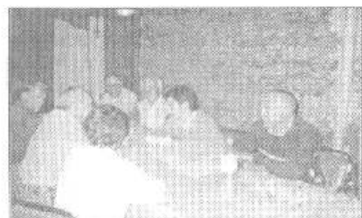
La cría de conejos se trató en todos sus detalles

Se reunió con los cunicultores de nuestra localidad.