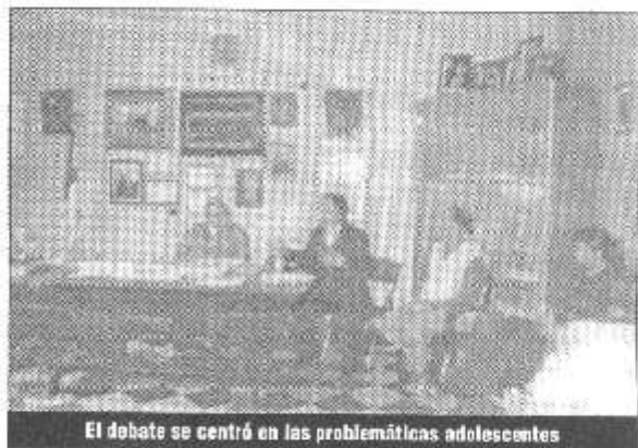
El debate se centró en las problemáticas adolescentes

La próxima reunión se realizará ya con los grupos de trabajo conformados.