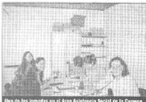
Una de las jornadas en el Área Asistencia Social de la Comuna

Trabajaron durante dos jornadas en forma intensiva y permanente, y a la vez asesoraron a las trabajadoras sociales de nuestra Comuna para poder hacer estos relevamientos del Monotributo Social en la región.